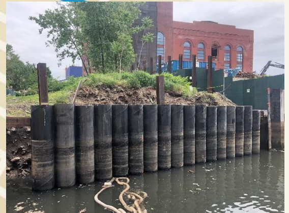
División de pilotes tubulares en la antigua dársena de maniobras de 1 st Street