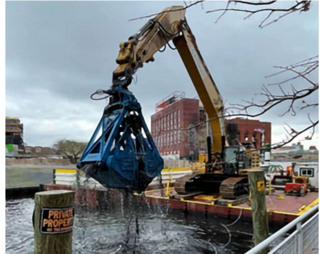
Excavadora extrayendo sedimentos del canal Gowanus entre los puentes de Carroll y 3 rd Street

El material dragado se colocó en pequeñas barcazas y se transportó por el canal hasta una zona de escala en las calles Smith y Huntington. En la zona de escala, el agua se extrajo del sedimento, se sometió a tratamiento y se bombeó de nuevo al canal. Luego, el sedimento deshidratado se trasladó a una barcaza más grande y se transportó a una instalación externa. La mayor parte del sedimento se procesó para que pueda utilizarse de forma beneficiosa como cobertura de relleno sanitario. Las porciones de sedimentos que contenían altos niveles de contaminación fueron tratados térmicamente, tras lo cual se sometieron a un procesamiento para poder usarlos de forma beneficiosa.