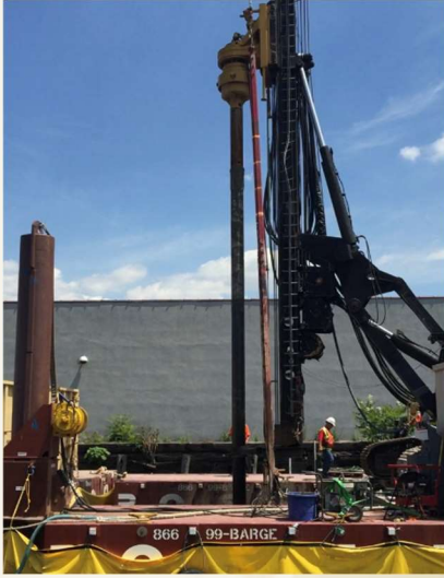
Barrena mezclando cemento con el sedimento nativo contaminado durante la ISS piloto en la dársena de maniobras de 7 th Street (realizado en